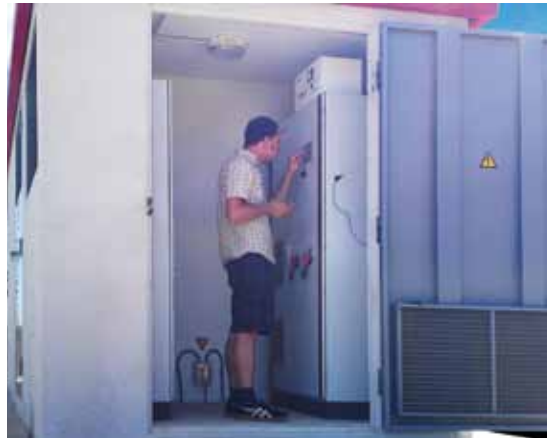
■ 217.35 kWp ■ PVmaster: PVMB 0200 ET ■ Spain