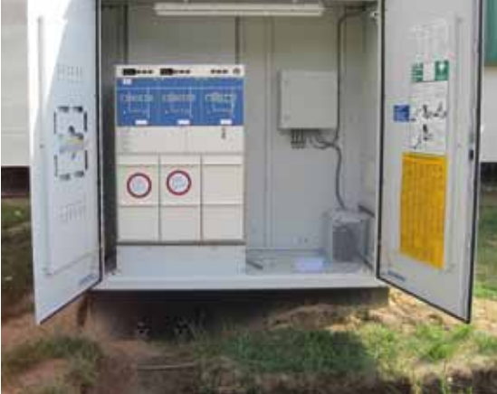
■ 1.532 MWp ■ PVmaster: 3 x PVMC 0500 EM ■ Germany