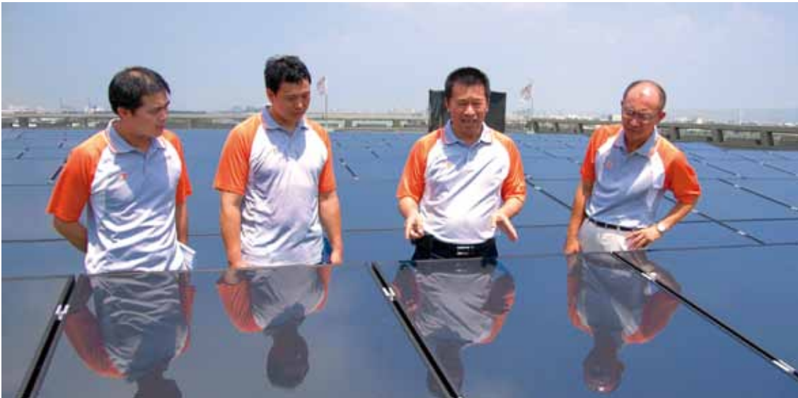
■ 68 kWp ■ PVmaster: PVM 450-068 TT ■ Taiwan