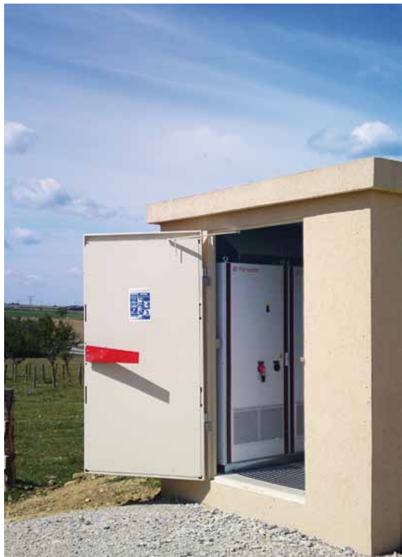
■ 401.4 kWp ■ PVmaster: PVMB 0400 OT ■ France