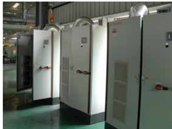
■ 268 kWp ■ PVmaster: 2 x PVM 450-100 TT, 1 x PVM 450-068 TT ■ Taiwan